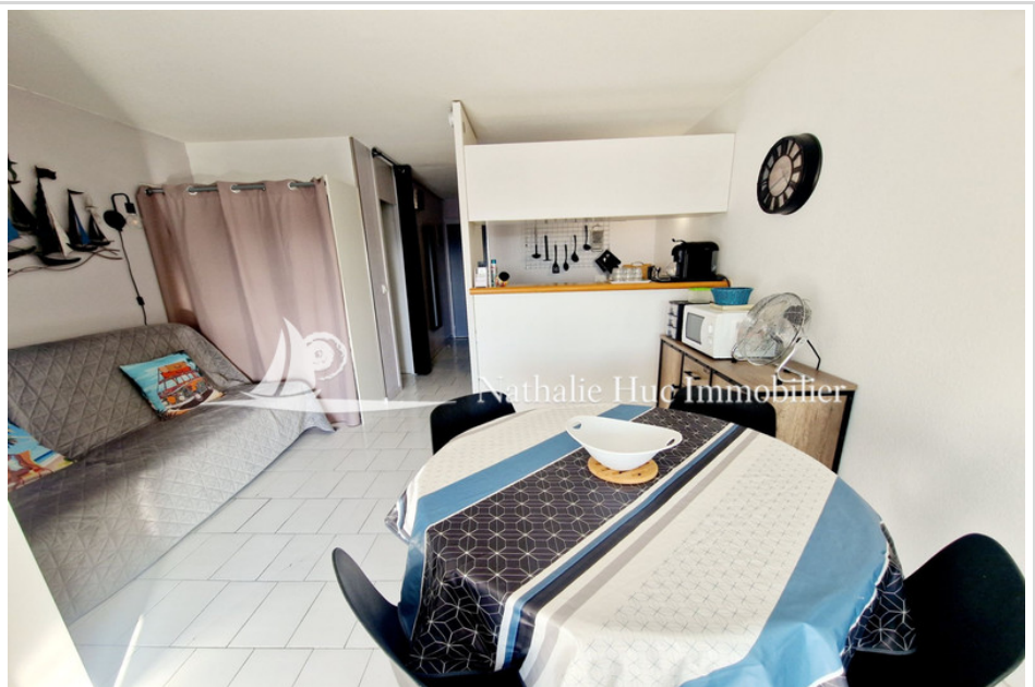
Studio cabine Canet-Plage

66140 CANET PLAGES. Rare grand studio cabine lumineux et agréable, situé au 3ème étage avec ascenseur, dans une résidence sécurisée avec gardien. Composé d'une pièce de vie avec espace cuisine équipée, wc séparé, une salle d'eau, une cabine, un cellier et une belle loggia avec une vue magnifique sur l'étang et le Canigou. Place de Parking. Réf. : 433V2069A - Mandat n°9092